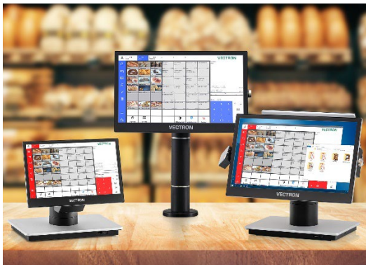
Die Vectron POS 7-Reihe: High-End-Kassensysteme mit flexiblen Installationsmöglichkeiten