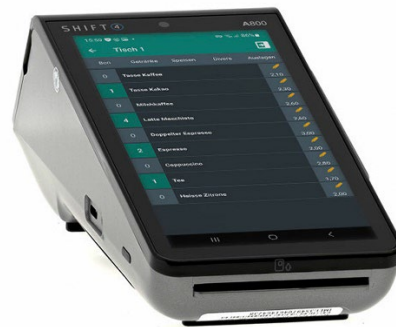
Zwei Bestell- und Bezahlungsterminals A800 sind in VECTRON SMART enthalten