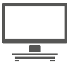
Variante POS 7 sobre soporte

La caja del sistema puede ser separada con facilidad del resto del hardware posibilitando, por ejemplo, colgarla bajo el mostrador. De esta manera se facilita también el cableado y se ofrece la posibilidad de montaje sobre soporte y en pared.