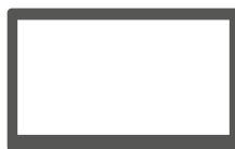
Variante POS 7 con soporte VESA para montaje en pared