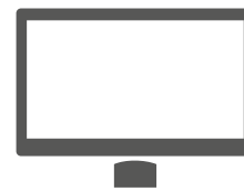
VESA-Variante der POS 7 als Untertischmontage